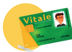
● Votre carte vitale