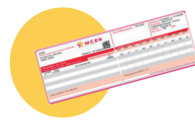
● Votre carte de mutuelle