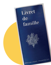
● Le livret de famille (en cas de prise en charge de votre enfant)

Ce livret vous présente de façon chronologique toutes les étapes du parcours de soins au sein de notre établissement. Nous vous remercions d'en prendre connaissance et de le conserver avec vous. Vous trouverez à la fin de ce livret un rabat au sein duquel vous pourrez intégrer les documents qui vous sont remis. Vous trouverez d'ores et déjà intégrés à ce livret en annexe :