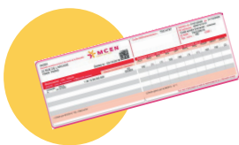
● Votre carte de mutuelle