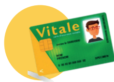
● Votre carte vitale