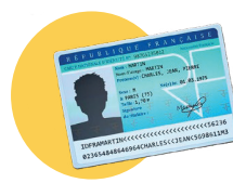
● Votre pièce d'identité