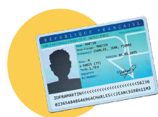
● Votre pièce d'identité